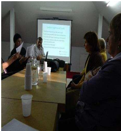
Isikliku abistaja teenus lõpuseminar

Kestis projekt "Isikliku abistaja teenuse arendamine Viljandimaal" KÜSK SVF toel. Osutasime teenust 4 KOV-s, neist kahes KOV rahalisel toel. Aasta jooksul toimus kaks koolitust (vebruar, juuli) abistajatele, klientidele ja KOV sotsiaaltöötajatele. Teemaks oli nägemis- ja liikumisraskustega klientide vajadused/kuidas neid märkamatult abistada; isikliku abistaja enese motiveerimine. Projekti lõppedes oli abistajaid kokku 10, osa neist vabatahtliku lepinguga ja 14 klienti. Peale projekti (30.10.2013) jätkus tore koostöö KOVdega, teenust osutatakse edasi 3 KOVs.