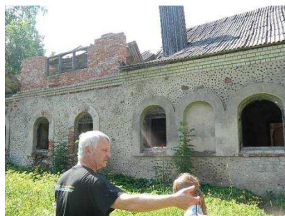
Maja, mis vajab jäädvustamist