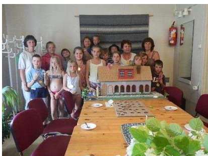
Makett, mida lapsed laagris valmistasid